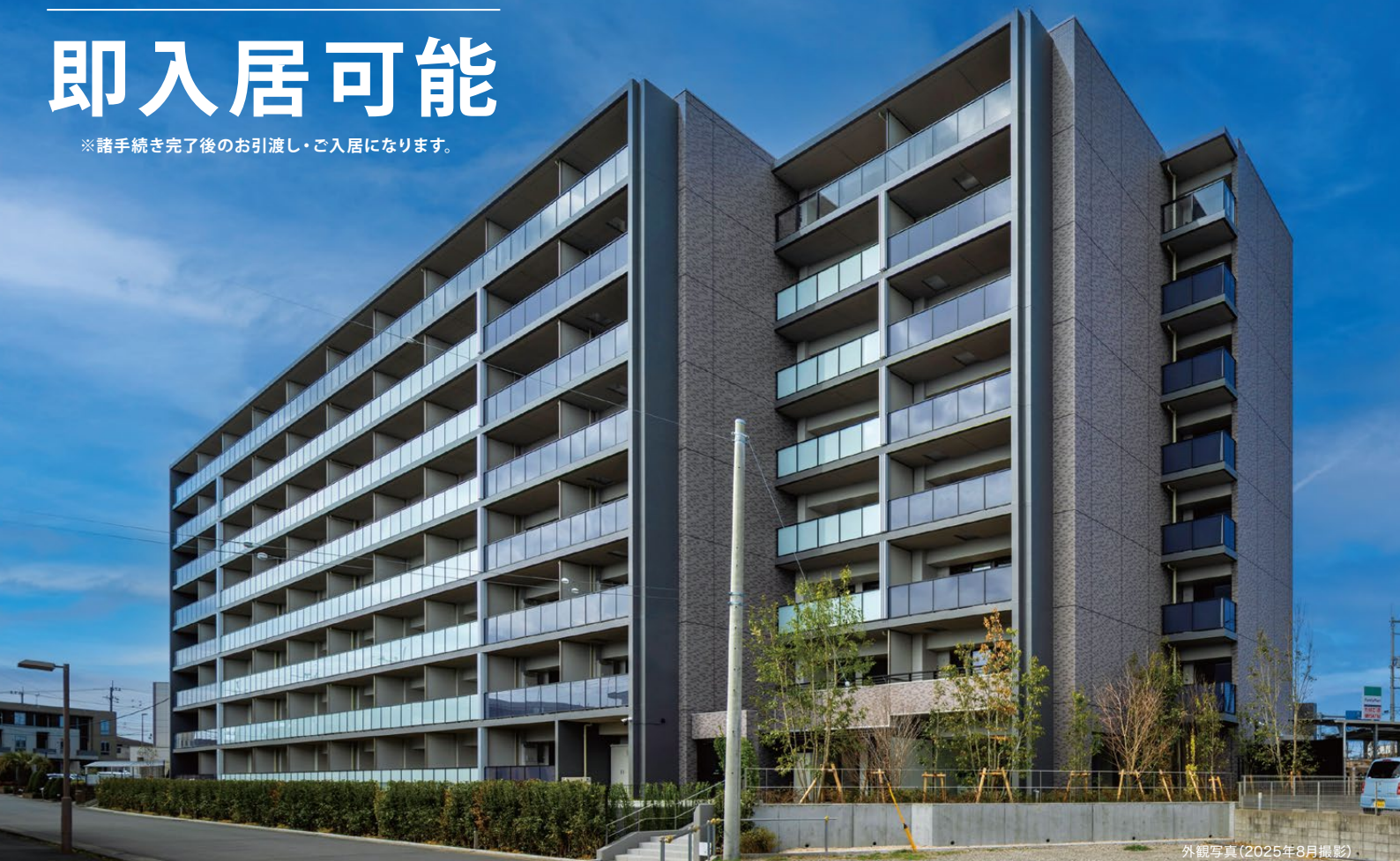
外観写真(2025年8月撮影)