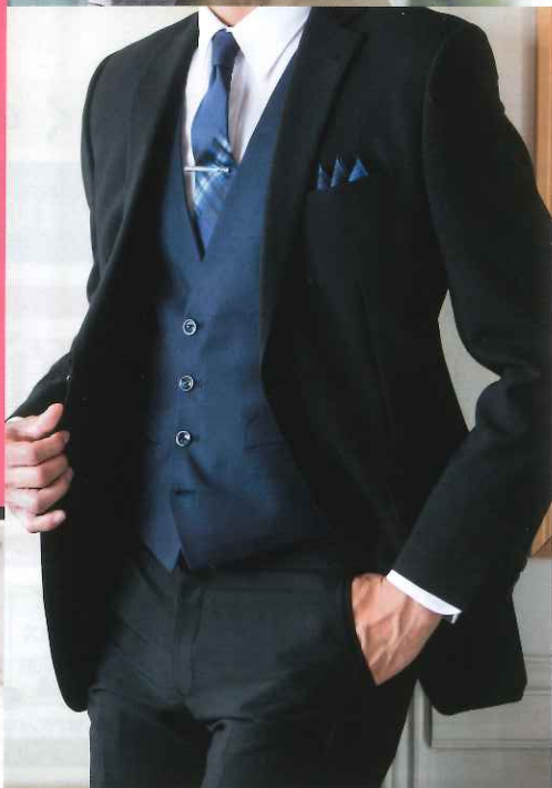
●写真はイメージです。